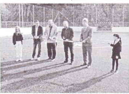
Tantó Viktor polgármester

Bízom benne, hogy sokan örömeiket fogják lelteni ebben a pályában. Fontosnak tartom ezt a pályát annak ellenére, hogy sokan ellenérzésüket fejezték ki ki miatta és megkérdőjelezték azt is, hogy kell-e ez nekünk?! Igen kell! Több okból is! A sport fontos életünkben, mert nem csak megerősít, hanem tanít is és összekovácsol. Főleg gyerekkorban célt adhat az életünknek és ha csak 10-ből 2 fiatal ez által kiteljesedhet és mai rossz dolgok helyett a sporthoz fordul, akkor már megérte ezt a pályát megépíteni. Kérek mindenkit, hogy vigyázzunk és becsüljük meg! Sokáig használhassák mind a gyerekek az iskolában, mind baráti társaságok akik csak jól akarják magukat érezni!